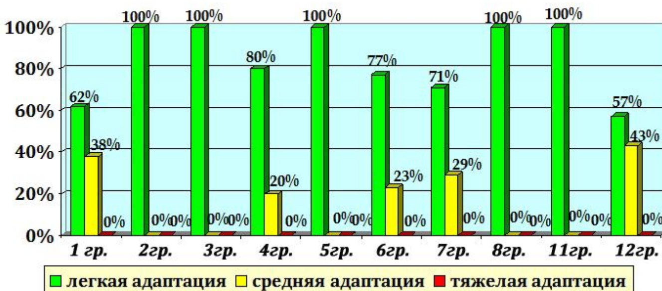
Степень адаптации вновь поступивших детей

■ Легкая адаптация ■ Средняя адаптация ■ Тяжелая адаптация